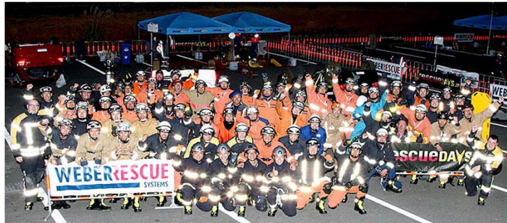
Picture : 集合写真 スノーピークヘッドクォーター

人命救助のプロフェッショナル達の熱い一日が今日も始まる。Second day。下の写真は、昨日のもの。受講を終えた彼らの表情は、自信に満ち溢れている。